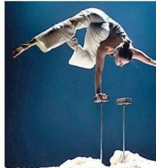
Lo spettacolo «Exit Cabaret»

«Dopo vent'anni sulla piazza torinese portiamo nel Monregalese la prima edizione di un festival che diventerà tradizione - continua Stratta -. È il primo passo di un progetto che diven-