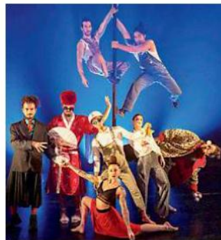
Alcuni dei protagonisti

Organizzato dal Centro nazionale di produzione blucinQue Nice in collaborazione con Fondazione Cirko Vertigo e Fondazione Piemonte dal Vivo, l'evento si svolge presso lo Chapiteau Nice, allestito in piazzale Giardini. Una serata di grande fascino che si concluderà come vuole tradizione nella notte dell'ultimo dell'anno con un brindisi di mezzanotte insieme agli artisti con spuman-