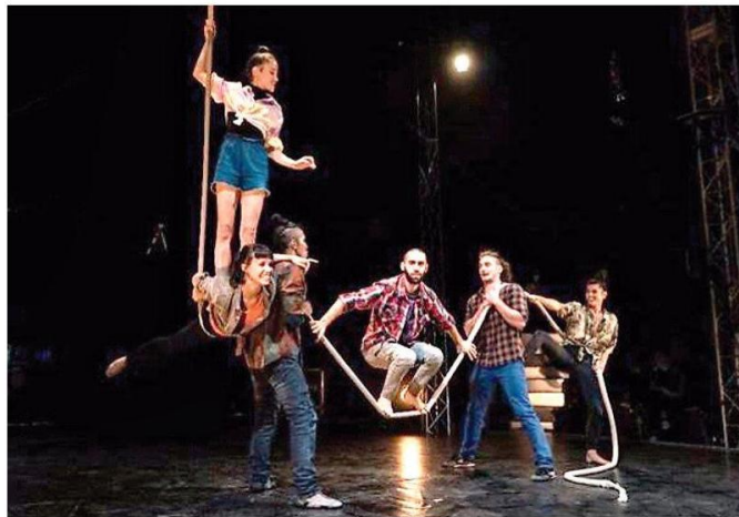
Alcuni artisti del Cirko Vertigo impegnati nelle prove dello spettacolo

La proprietà intellettuale è riconducibile alla fonte specificata in testa alla pagina. Il ritaglio stampa è da intendersi per uso privato